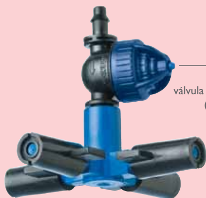
Super LPD válvula antidrenante (alta presión)

Para un óptimo enfriamiento y humidificación de invernaderos