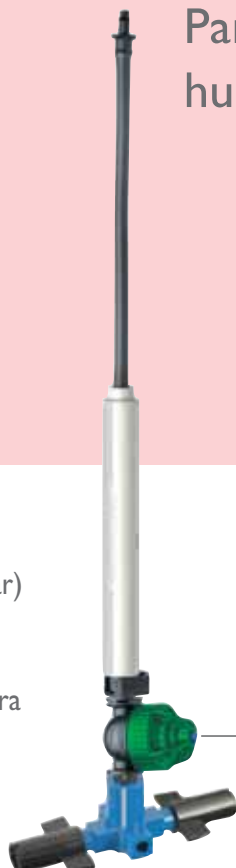
Super LPD válvula antidrenante (media presión)